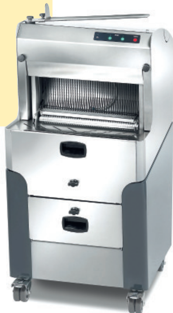
■ MHS BASIC